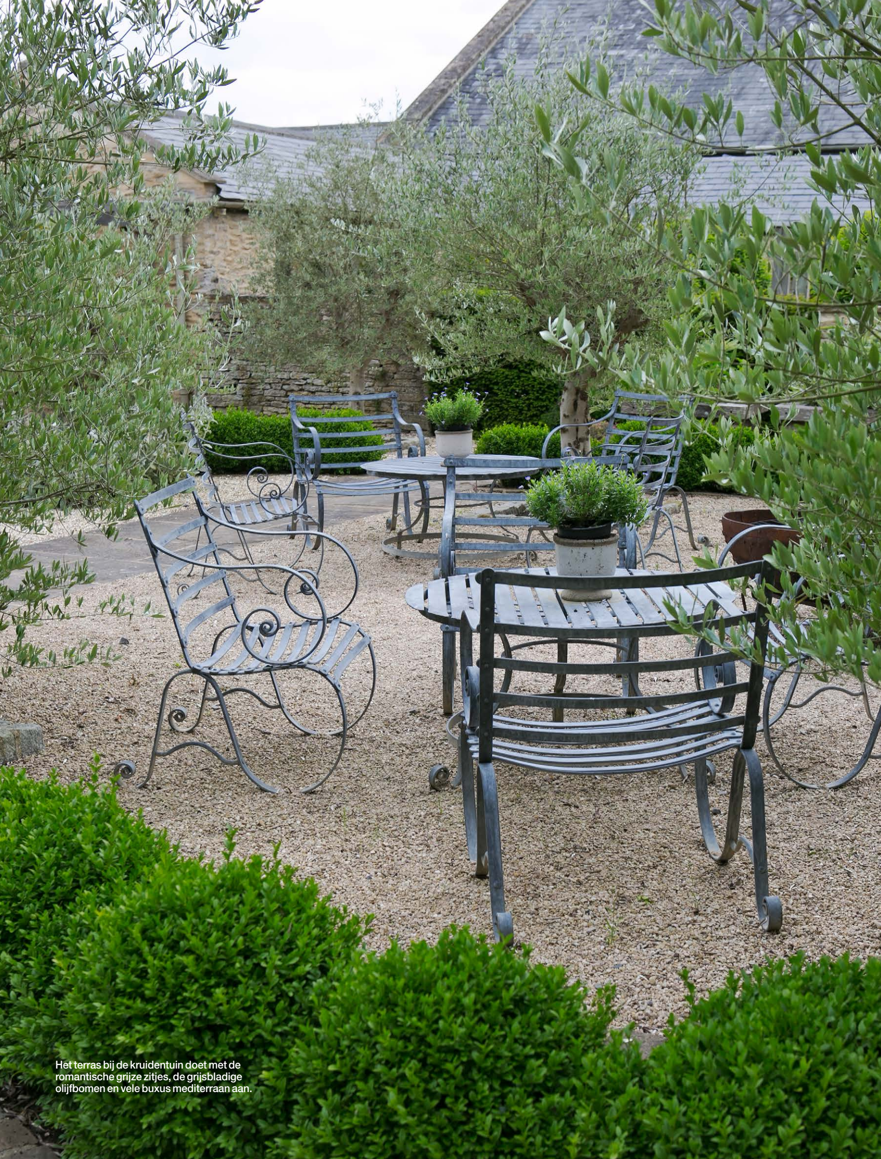
Het terras bij de kruidentuin doet met de romantische grijze zitjes, de grijsbladige olijfbomen en vele buxus mediterraan aan.