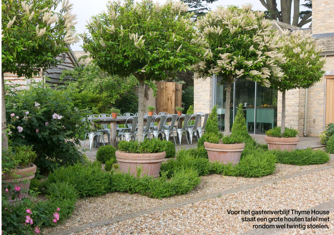
Voor het gastenverblijf Thyme House staat een grote houten tafel met rondom wel twintig stoelen.